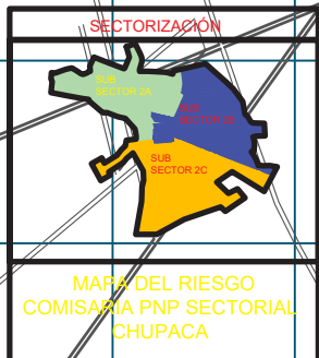
MAPA DE RIESGOS 2024